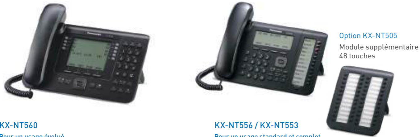
Option KX-NT505 Module supplémentaire 48 touches

Si vous n'avez pas besoin de fonctionnalités complètes, Panasonic offre également toute une gamme de téléphones SIP pour vos communications de base. Pour obtenir de plus amples détails sur ces téléphones SIP, veuillez consulter notre brochure HDV.